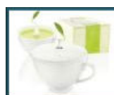
Tè e infusi